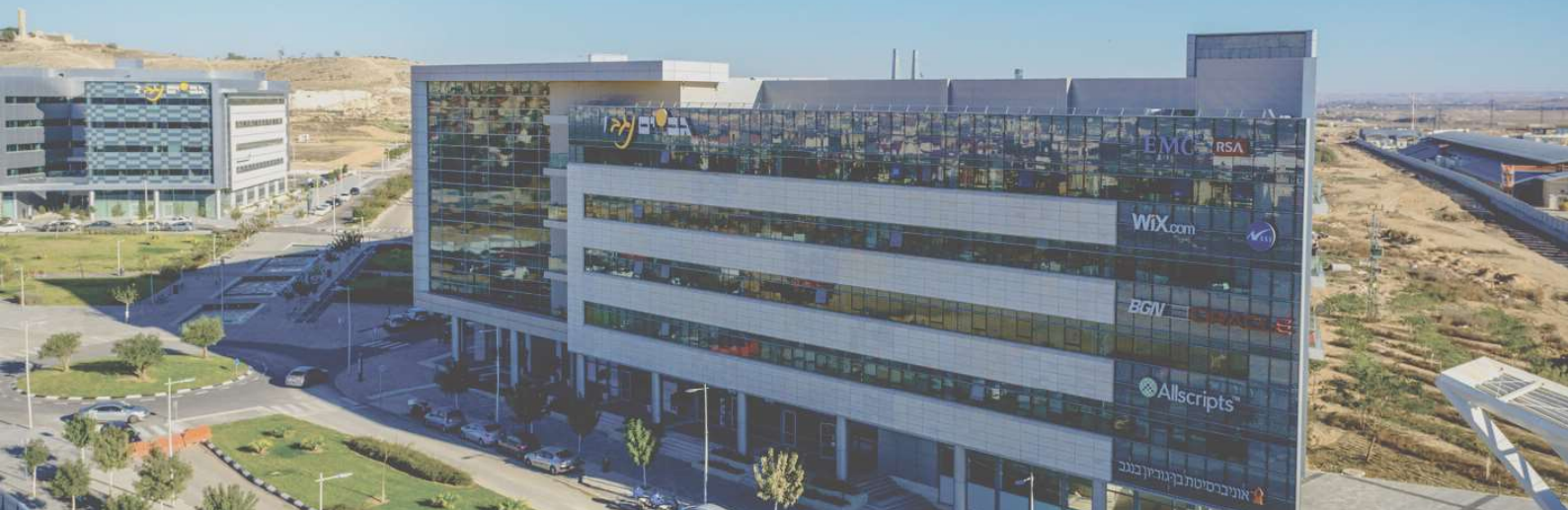
Zu Besuch im Gav Yam Negev Advanced Technology Park in Be'er Sheva

Die Geschichte Israels selbst lässt schon einen kleinen Einblick in die Denkweise der Israelis zu.