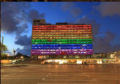
Be'er Sheva bei Nacht