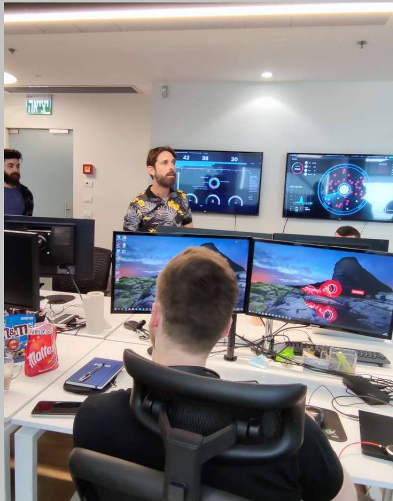
Besichtigung im Bereich Cybersicherheit bei Cynet in Rischon LeZion