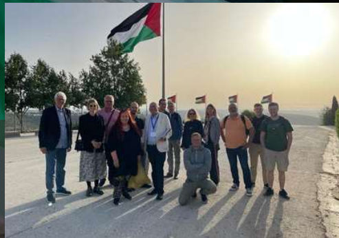
Palästinensische Reisbrettstadt Rawabi