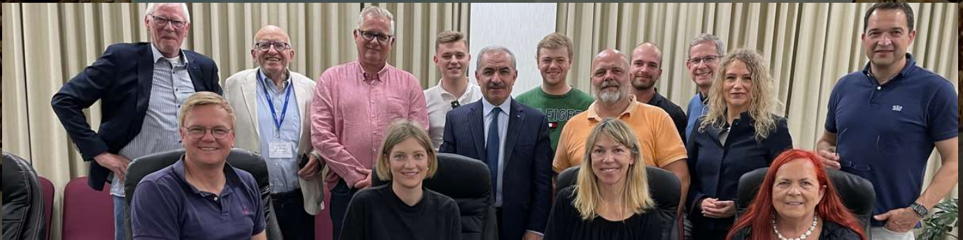
Eines der Highlights: Unser Treffen mit dem Ministerpräsident von Palästina Dr. Mohamad Schtajeh