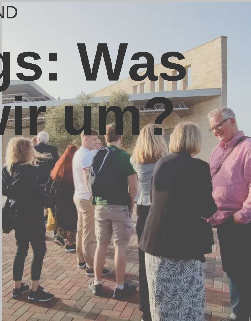
Das Netzwerken steht bei unseren Reisen an erster Stelle