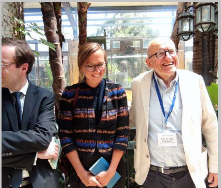
Im Gespräch mit dem deutschen Vertretungsbüro