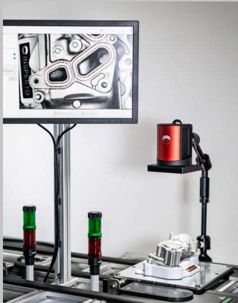
Autonomous Machine Vision revolutioniert die Qualitätskontrolle am Fließband