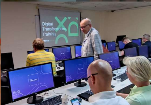
Thrive DX – Education Technology

Die Dinge funktionieren in Israel anders als bei uns in Deutschland. Sobald Israelis eine Idee haben, gründen sie ein Start-up. Sollte die Idee scheitern – kein Problem, die nächste Idee steht in den Startlöchern. Die Unternehmer-Kultur ist geprägt von absoluter Fehlerfreundlichkeit.