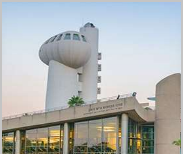
Weizmann Institute of Science