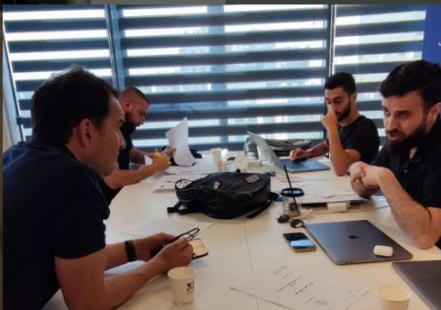
Meeting mit palästinensischen Start-ups

Die kommunalen Werte sind in Israel mit einem sehr hohen Stellenwert belegt.