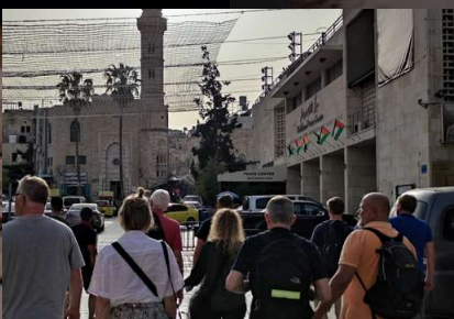
Tour durch Bethlehem

Wer nicht an Wunder glaubt, ist kein Realist. David Ben Gurion